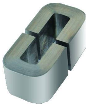
CORE M5 T30