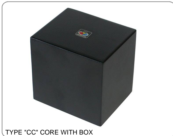
TYPE "CC" CORE WITH BOX