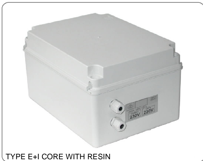
TYPE E+I CORE WITH RESIN